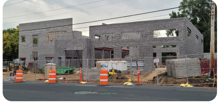
Công Trường Xây Dựng Trạm Cứu Hỏa số 4, 4201 West 84th Street, tháng Chín, 2022.

Hội Đồng Thành Phố Bloomington sẽ tổ chức một buổi điều trần công cộng để lắng nghe ý kiến của quý vị về đề xuất thu thuế và ngân sách năm 2023 vào lúc 6:30 tối Thứ Hai, ngày 5 tháng Mười Hai tại Phòng Hội Đồng ở Civic Plaza, 1800 West Old Shakopee Road. Để biết hướng dẫn về cách tham gia trực tiếp hoặc qua điện thoại, vui lòng truy cập blm.mn/cc-1205 hoặc gọi 952-563-8790.