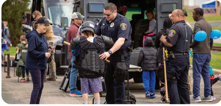
Sở Cảnh Sát Bloomington tổ chức sự kiện mở cửa đón khách vào tháng Năm, 2022.